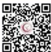
西幼招生就业公众号